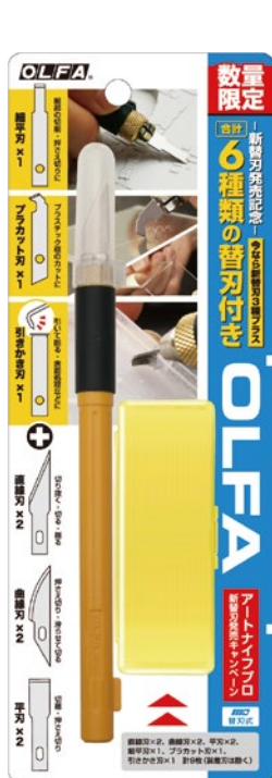
157B アートナイフプロ