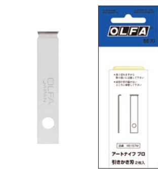
XB157M アートナイフプロ替刃 引きかき刃