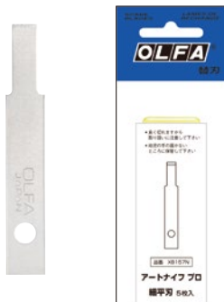
XB157N アートナイフプロ替刃 細平刃