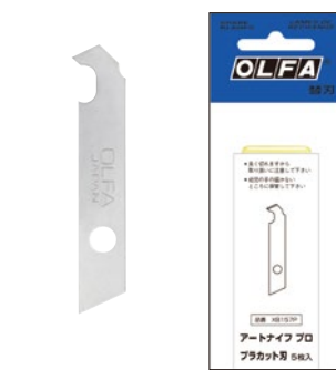
XB157P アートナイフプロ替刃 プラカッタ刃